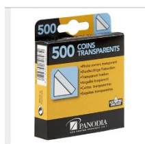
Exemple de coins à utiliser